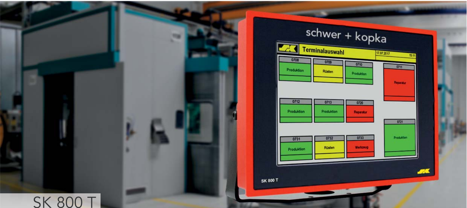
SK 800 T